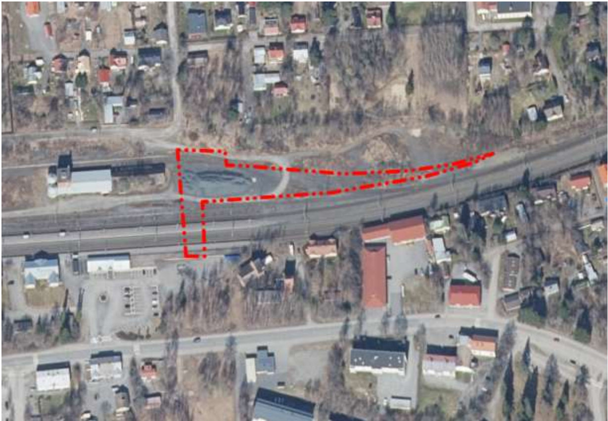
Kuva 1: Kaavamuutosalueen sijainti ilmakuvassa

Osallistumis- ja arviointisuunnitelmaa (OAS) päivitetään tarpeen mukaan koko suunnittelutyön ajan ja on nähtävillä kaupungin verkkosivuilla sastamala.fi .