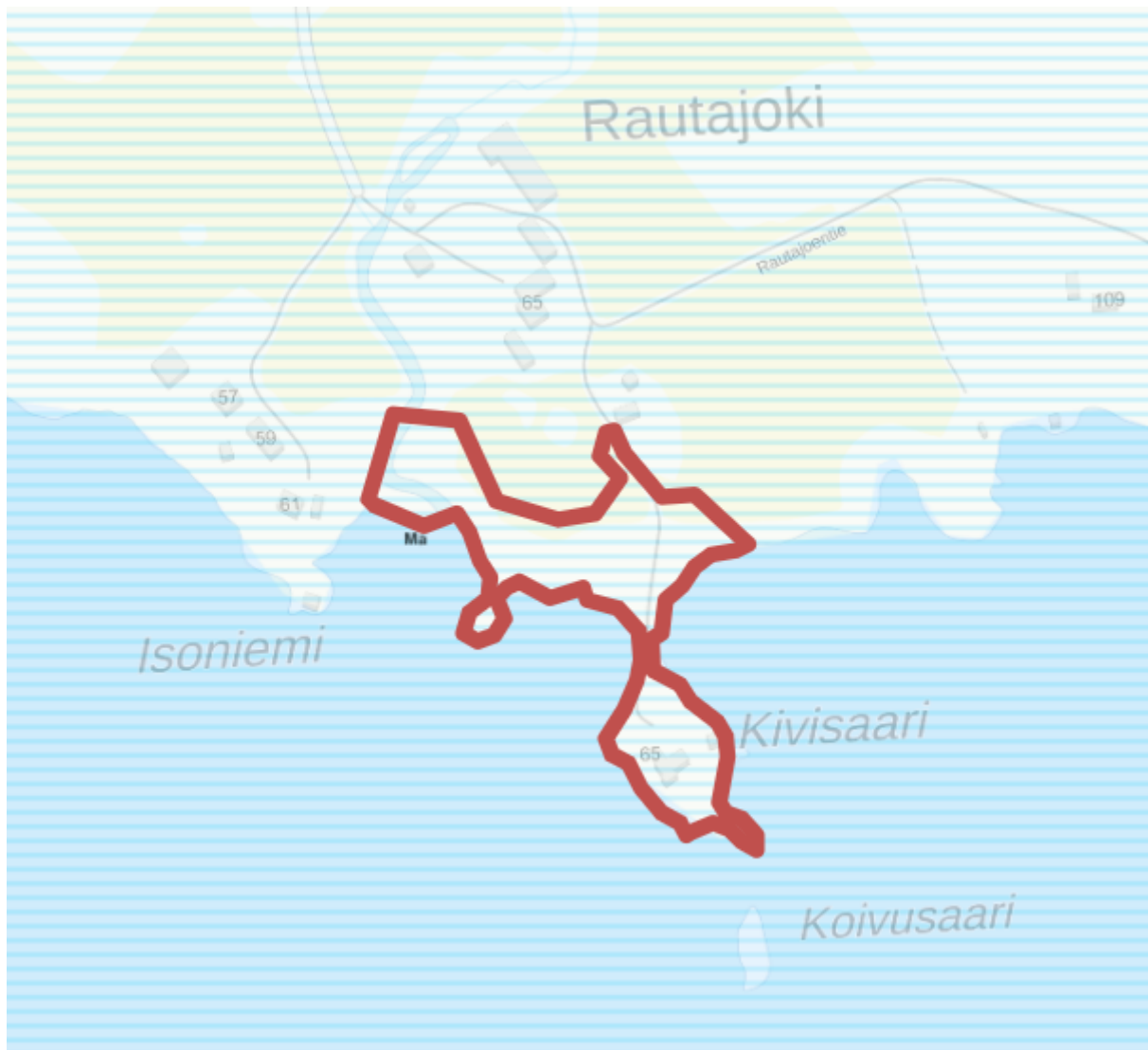
Kuva 3: Ote Pirkanmaan maakuntakaavasta, suunnittelualue rajattu punaisella