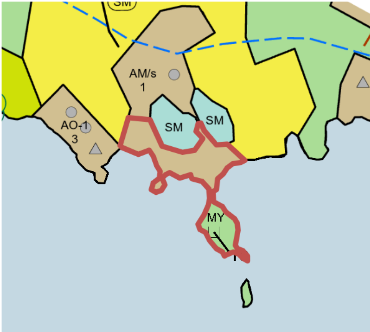
Kuva 4: Ote Rautaveden länsirannan osayleiskaavasta, suunnittelualue rajattu punaisella