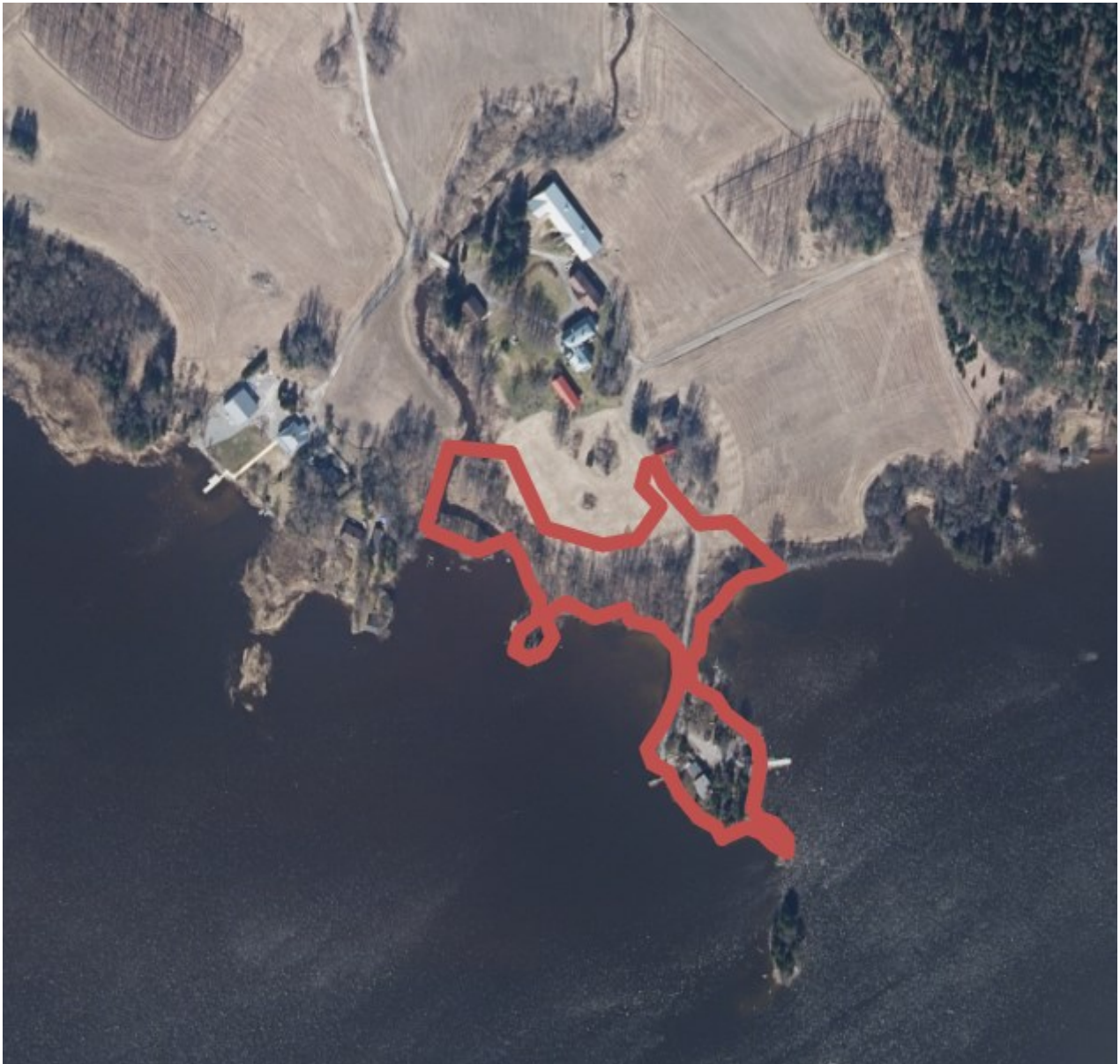
Kuva 2: Ortoilmakuva, suunnittelualue rajattu punaisella