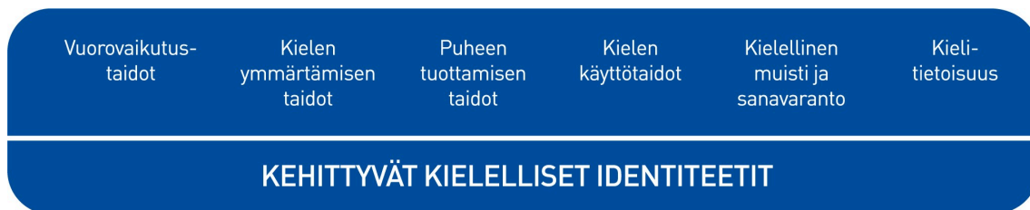
Kuvio 2. Lasten kielen kehityksen keskeiset osa-alueet varhaiskasvatuksessa

Kielen oppimisen kannalta on tärkeää tiedostaa, että saman ikäiset lapset voivat olla eri vaiheissa kielen kehityksen eri osa-alueilla. Kielelliset identiteetit kehittyvät , kun lapsia ohjataan ja tuetaan kielellisten taitojen ja valmiuksien keskeisillä osa-alueilla.