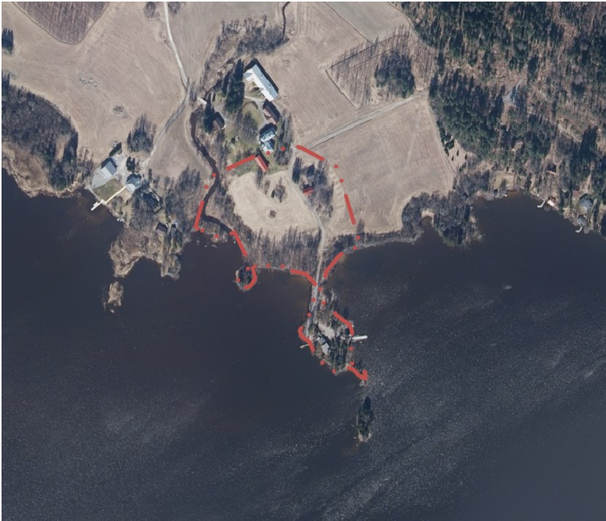
Kuva 2: Ortoilmakuva, suunnittelualue rajattu punaisella