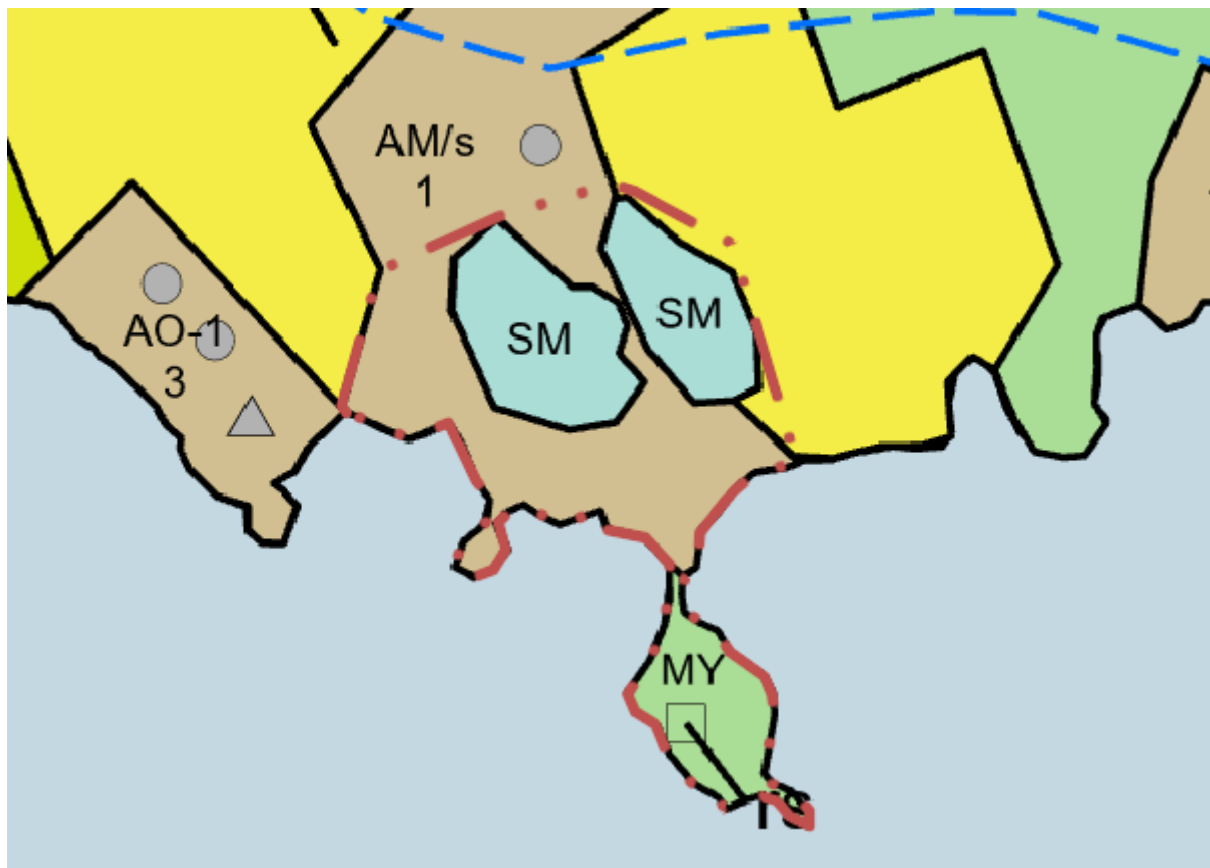
Kuva 4: Ote Rautaveden länsirannan osayleiskaavasta, suunnittelualue rajattu punaisella

Teleliikenteen mastoja alueelle sijoitettaessa on maisemalliset arvot otettava erityisesti huomioon ja vältettävä uusien mastojen rakentamista maisemallisesti hallitseviin ja näkyviin paikkoihin.