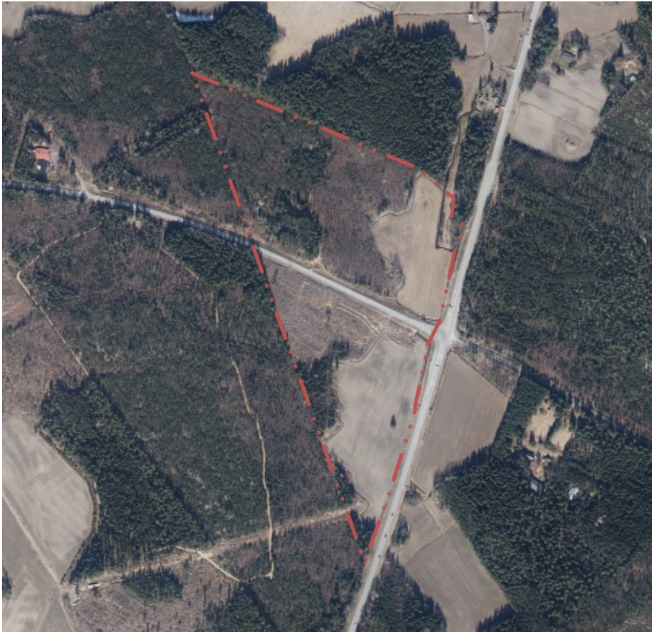
Kuva 2 Kaavamuuotosalueen sijainti ilmakuvassa, suunnittelualue rajattu punaisella pistekatkoivilla.