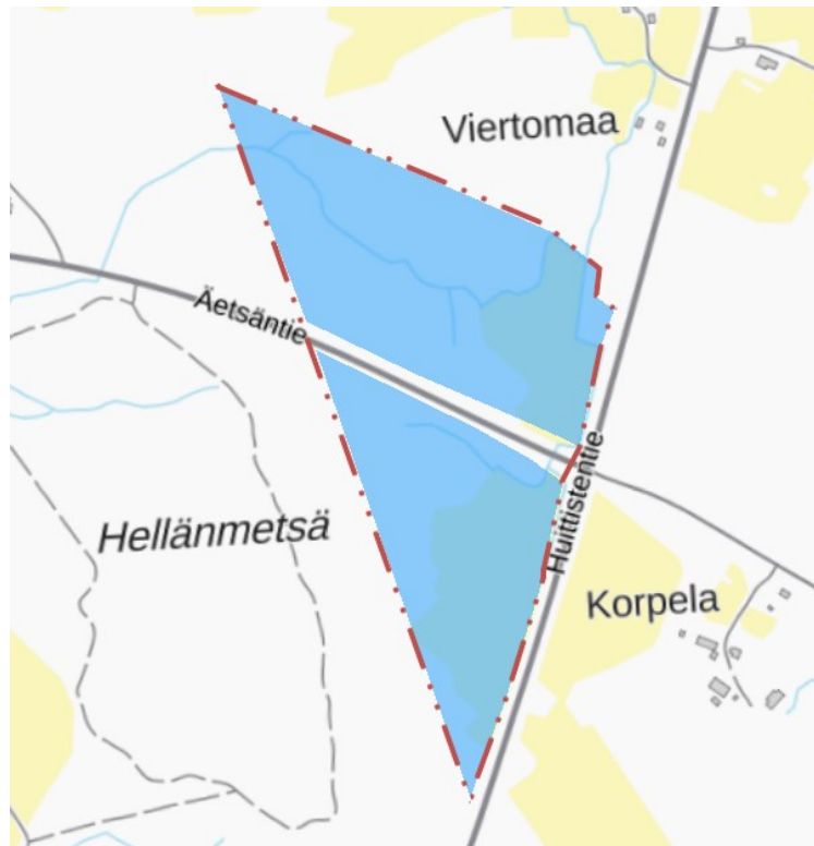
Kuva 5 Kaupungin maaomaisuus sinisellä, suunnittelualue rajattu punaisella pistekatkoviivalla.