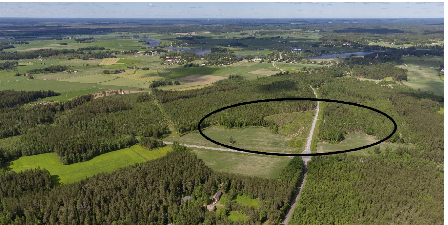
Kuva 3 Viistoilmakuva suunnittelualueesta ja sen lähiympäristöstä. Suunnittelualue kuvattuna likimääräisesti mustalla viivalla.