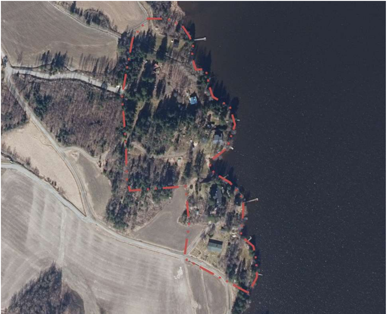
Kuva 1: Kaavamuutosalueen sijainti ilmakuvassa. Alue rajattuna punaisella katkoviivalla.

Osallistumis- ja arviointisuunnitelmaa (OAS) päivitetään tarpeen mukaan koko suunnittelutyön ajan ja on nähtävillä kaupungin verkkosivuilla sastamala.fi .